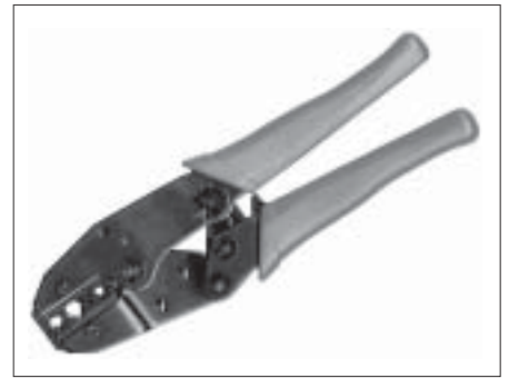
Crimpzange Wisi DZ85.

F-Crimp-Stecker werden mit einer geeigneten Crimpzange auf das korrekt vorbereitete Ende eines passenden Koaxialkabels aufgepresst. Auch hier ist das richtige Zusammenwirken von Stecker, Kabel, Werkzeug und seiner Handhabung für die langfristi-