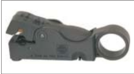
Koaxialkabel-Stripper MZ01 von Wisi.

stoffummantelung, Schirm und Dielektrikum bis auf den Innenleiter des Kabels durchtrennt und abgezogen. Nun äußerst vorsichtig weitere 8 mm des Mantels entfernen. Dabei dürfen keinesfalls Drähtchen des Abschirmgeflechts und die Abschirmfolie beschädigt werden. Es gilt aufzupassen, dass die feinen Drähtchen des